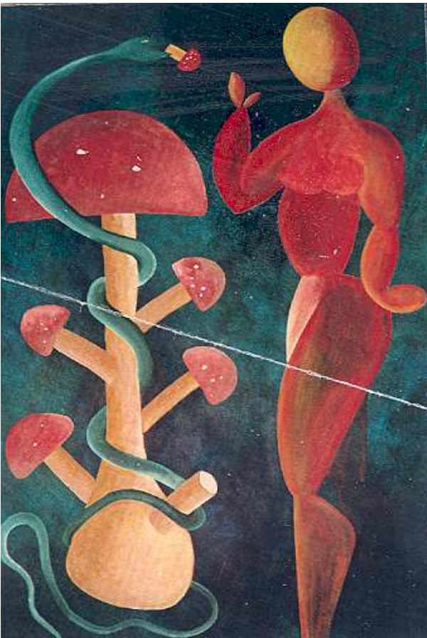
Bild des Berliner Malers Werner Kließ vom Fliegenpilz als Baum des Lebens. Die Schlange reicht Eva einen Fliegenpilz als „Apfel der Erkenntnis“

Die Quelle Hvergelmir speist die Flüsse der Welt. Beim Urdbrunnen leben die Schicksalfrauen, die vielwissenden Nonnen: Urd weiß um alles Vergangene,